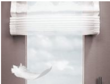
Raffrollo, Liftstore, Faltrollo, Raffgardine