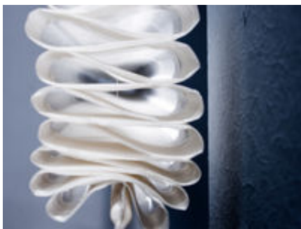
Raffrollo, Liftstore, Faltrollo, Raffgardine